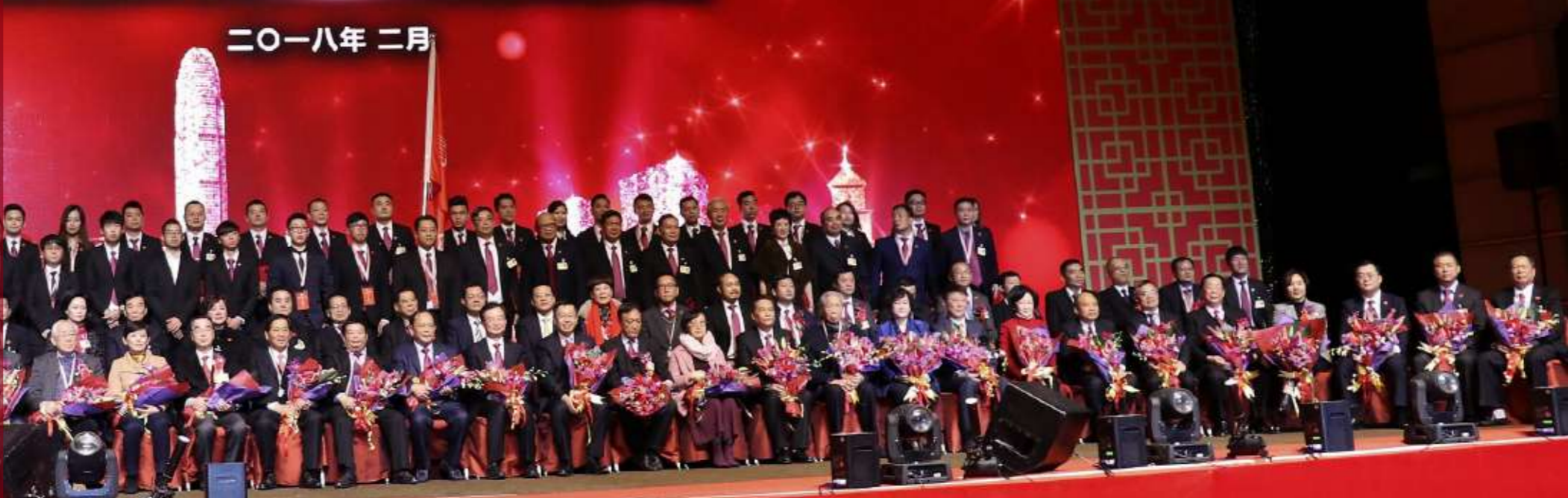
香港福州社团联合会成立庆典现场