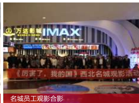
名城员工观影合影

观影过程中，有的员工甚至留下了激动而自豪的泪水。特别当看到俞主席出现在影片镜头时，更是纷纷拿下手机拍下这一值得记录的时刻，名城人的自豪感油然而生。