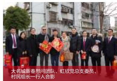
大名城新春慰问团队、虹欣党总支委员、村民组长一行人合影