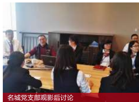
名城党支部观影后讨论