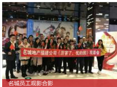
名城员工观影合影