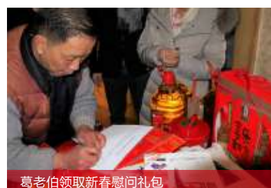
葛老伯领取新春慰问礼包