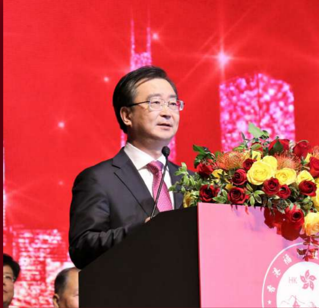
福建省委常委、福州市委书记王宁致辞