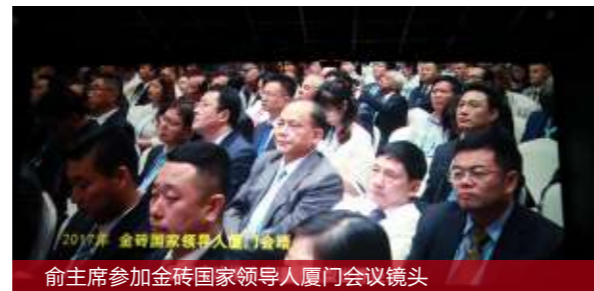
俞主席参加金砖国家领导人厦门会议镜头