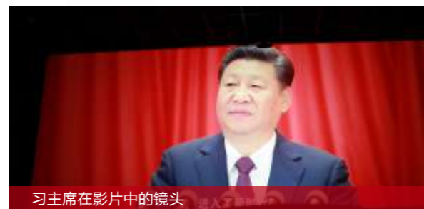
习主席在影片中的镜头

高科技突飞猛进，脱贫攻坚、医疗保障、生态文明建设、国家安全体制等各领域的显著成就，以朴实而伟大的真情感动着每一个观影的名城人。一个又一个生动具体的故事拉近了影片与观众的距离，让我们自豪于有幸生活在这样一个伟大的新时代。正如俞主席在畅谈十九大感想时说的：“只有中国好，世界才好！只有名城好，大家（名城人）才好！”